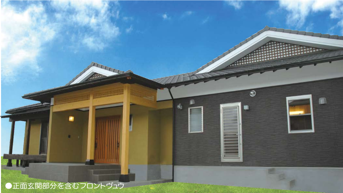
●正面玄関部分を含むフロントヴェウ

午前10時～午後5時 会場：綾町大字南俣 949-1 ●当日は、ノボリと案内板を目印にお越しください。