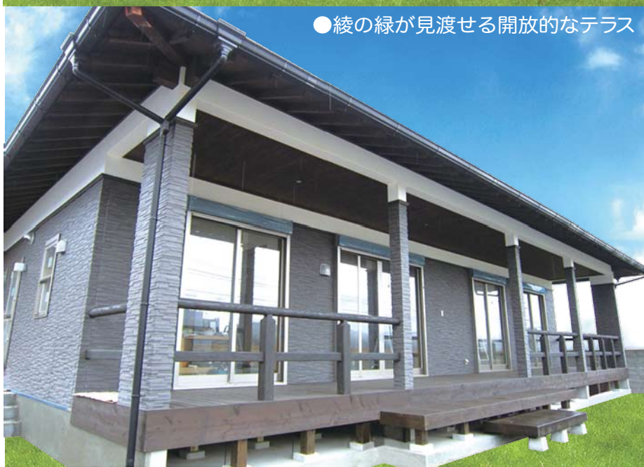
●綾の緑が見渡せる開放的なテラス