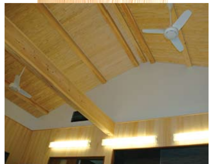
●開放的な吹抜けを楽しむリビング