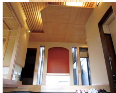
●広々とした玄関ホール