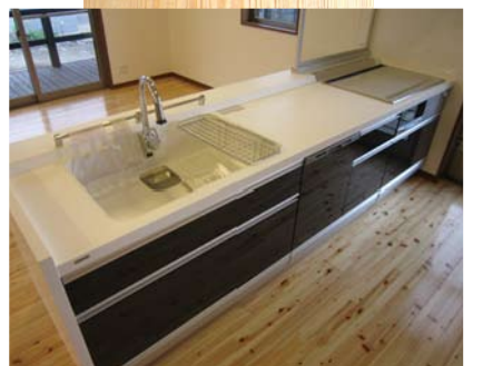
●オシャレな対面キッチン

建築概要 延床面積 190.91 m 2 (57.85 坪) 建築面積 230.66 m 2 (69.90 坪) 敷地面積 810.40 m 2 (245.5 坪)