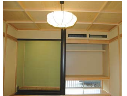
●伝統的でモダンな和室